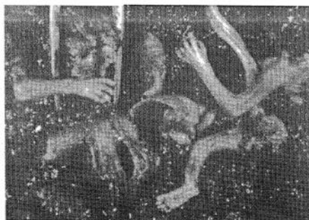
Avortement par aspiration à la 10 e semaine

(Titre VIII - Art. 66-1 de la Constitution)